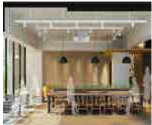
※カフェテリア (CG画像)