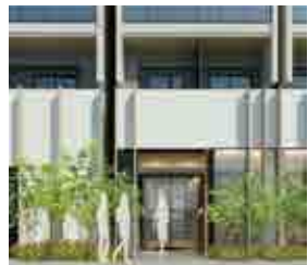
※エントランス前 (CG画像)

損害保険●個別加入必須 仲介※取引条件有効期限 2024年9月30日迄 【契約期間】1年~2年